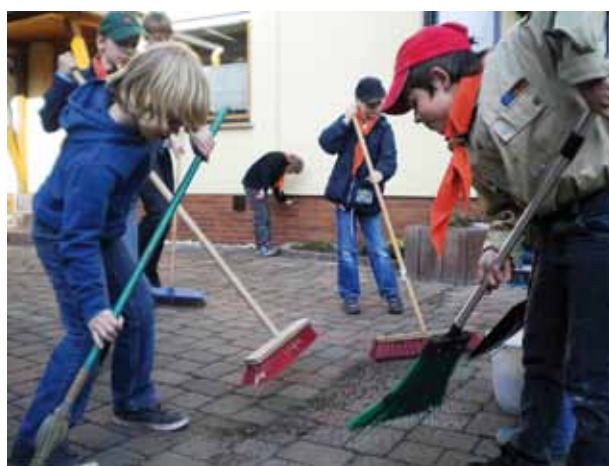
▲ Nach getaner Arbeit: Pfadfinder des Stammes Neuwied-City