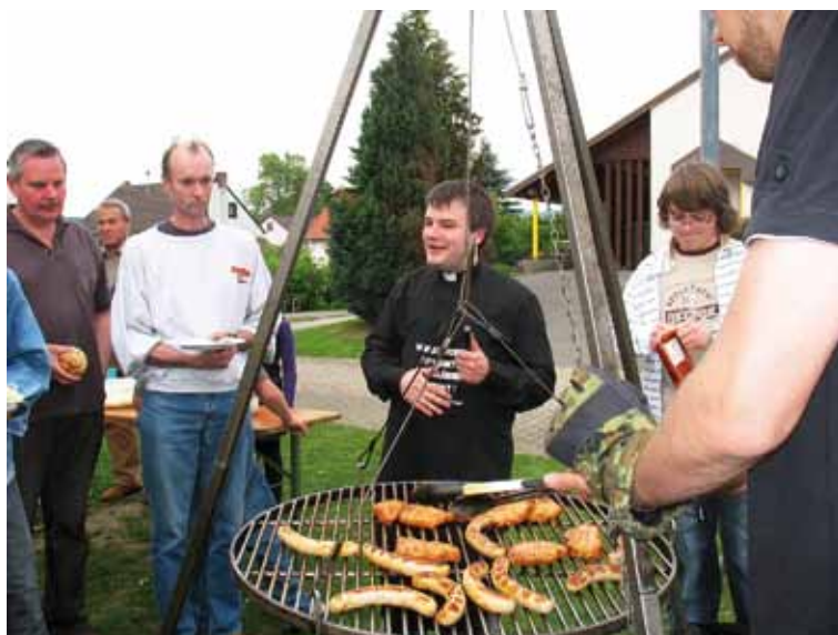
Der Mensch denkt, Gott lenkt. De Saarländer schwenkt.