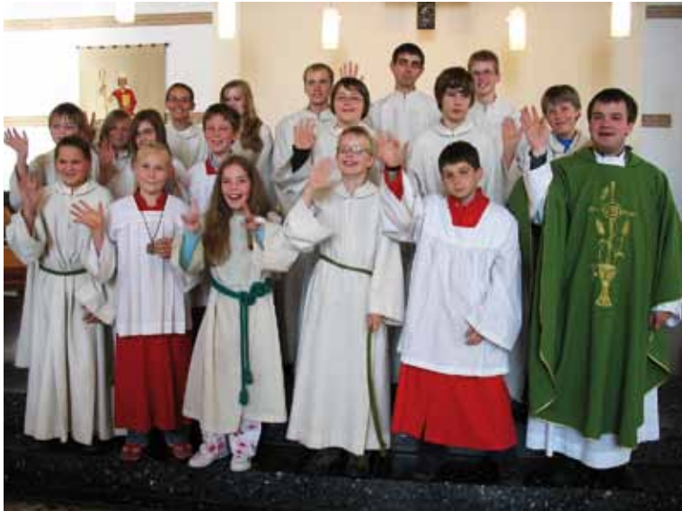
Messdienerneinführung: Die Messdiener lagen dem Kaplan besonders am Herzen.