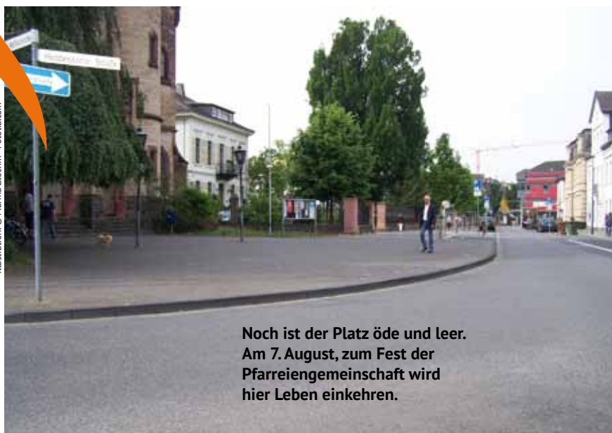
Noch ist der Platz öde und leer. Am 7. August, zum Fest der Pfarreiengemeinschaft wird hier Leben einkehren.