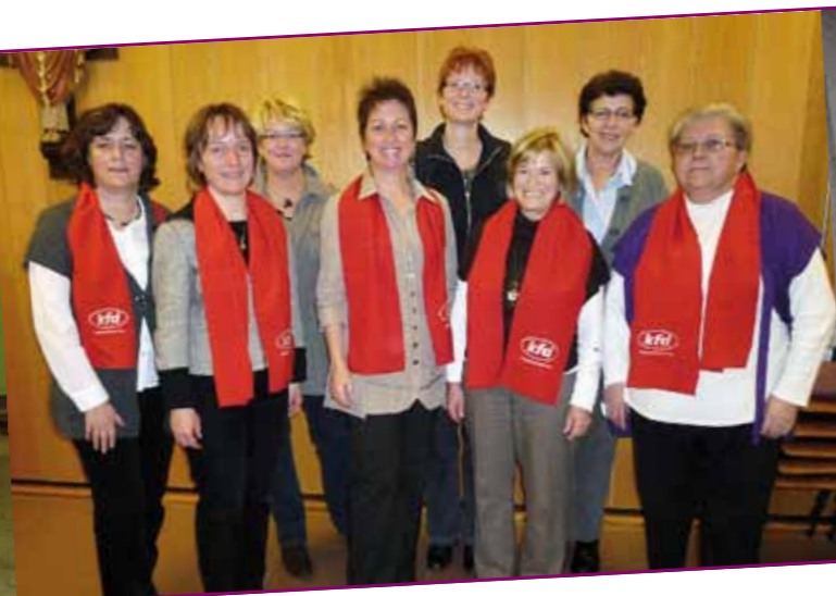
Leitungsteam der kfd Irlich