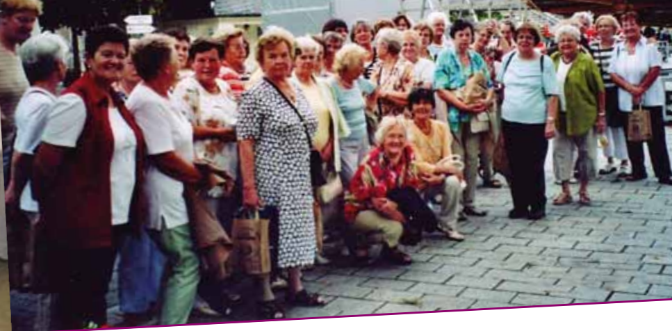
kfd St. Bonifatius