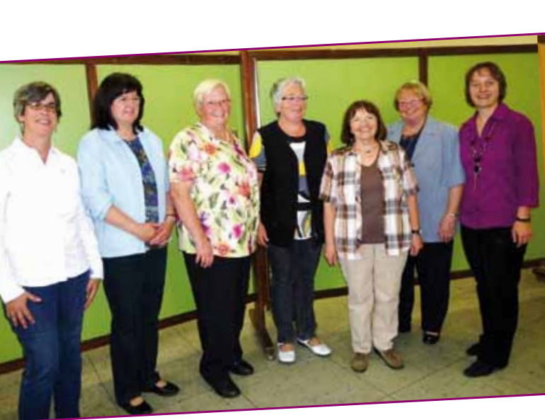
Das Leitungsteam und je zwei Frauen aus jeder Pfarrgruppe der fusionierten kfd St. Matthias