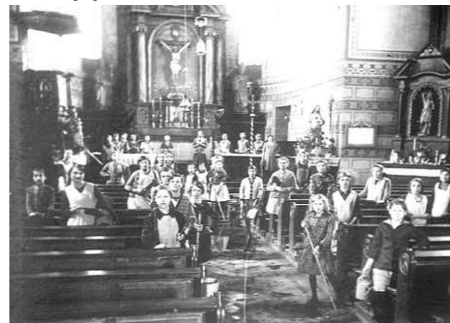
Kirchenreinigung vor 1935