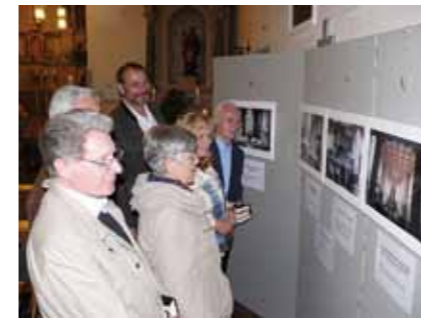
Ausstellung im September 2010