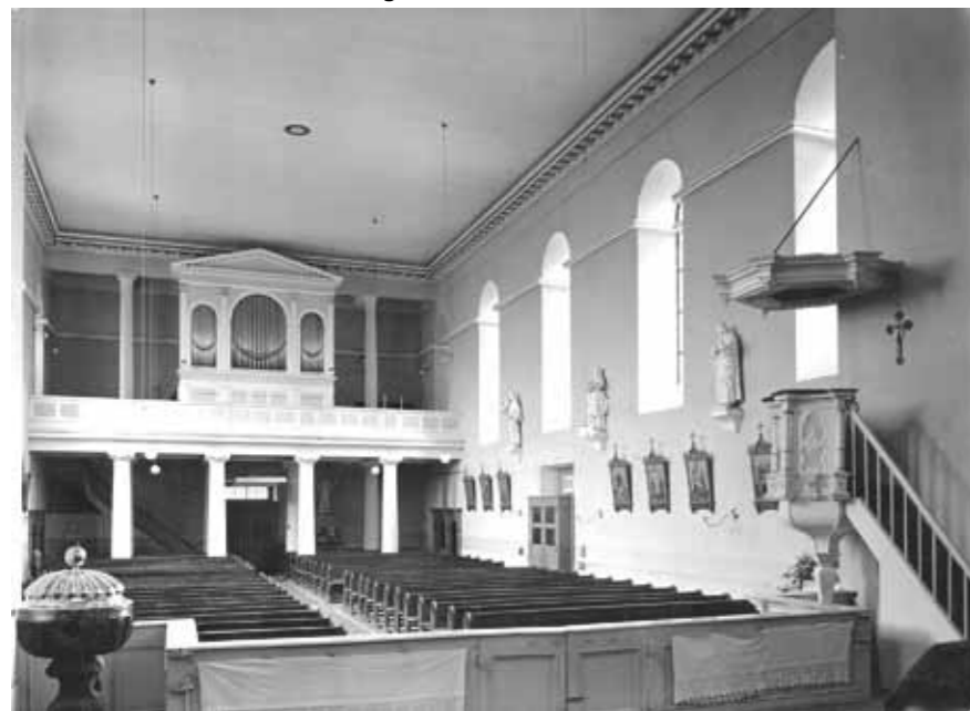
Kirchenraum vor dem 2. Weltkrieg